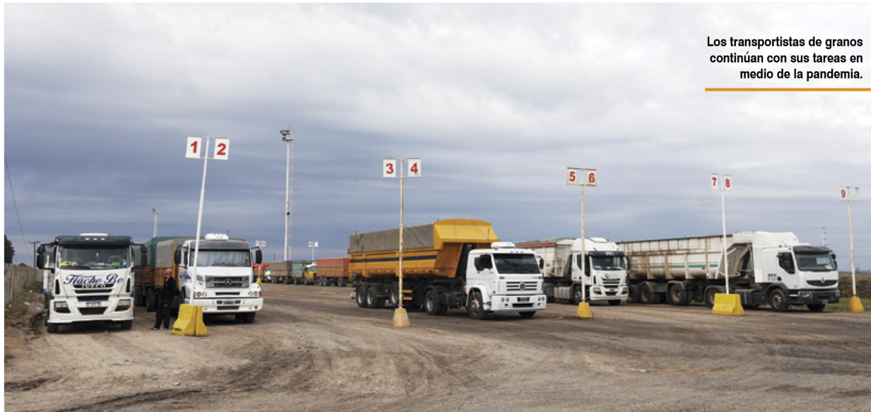
Los transportistas de granos continúan con sus tareas en medio de la pandemia.

Desde entonces, dirigentes de la Federación recorren acopios y puertos graneleros ubicados en diferentes regiones de la Argentina, con el fin de observar el cumplimiento de las medidas. Al mismo tiempo, se viene realizando un trabajo en conjunto con los distintos actores (públicos y privados) para incrementar las condiciones de seguridad,